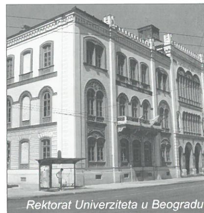
Rektorat Univerziteta u Beogradu

Uspešnost ove radionice potvrđuje i činjenica da je najavljeno organizovanje novih događaja sa istim ciljem.